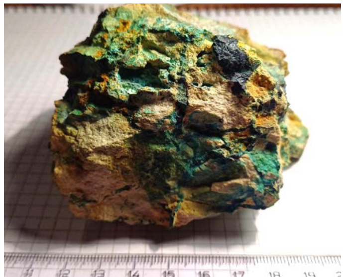
Kalkstück mit Adern aus Malachit und Azurit