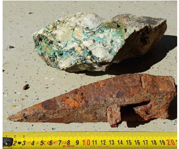
Kalkstück mit Malachitadern und das Bergeisen

Wann der Abbau auf Kupfererze begonnen wurde, ist leider aus dem Eintrag nicht zu entnehmen. Im Zuge einer gezielten Geländebegehung vor Ort konnten wir tatsächlich oberhalb der „Unsinnigen Kira“ in einem kleinen Gerinne mehrere Kalkbrocken mit Malachitadern entdecken. Direkt bei den abgebauten Gesteinsbrocken lag ein Bergeisen. Dieses hat wohl zum Abbau des Kupfererzes gedient. Das Gelände in diesem Bereich wurde durch den letzten großen Bergsturz im Jahre 1920 massiv verändert. Die gesamte Bergflanke ist auf der gesamten Länge mehrere Meter abgerutscht.